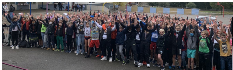
Présentation du comité « Handi Sport 53 »